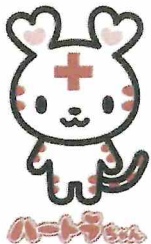
日本赤十字社公式 マスコットキャラクター